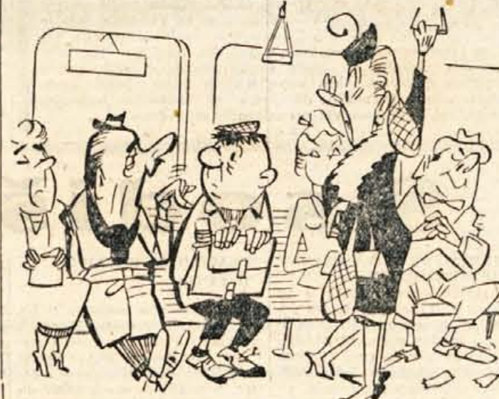
»Bodite no toliko olikani in odstopite moji ženi sedeži!«

Film »Kleopatrina« bo splošno edinstven v zgodovini filmske industrije. Liz Taylor sprejme za svoje vlogo nič več in nič manj kot milijon dolarjev, razen tega ima družba Twenty-Century-Fox še velike todatnje stroške, ker slabo vreme ovira snemanje.