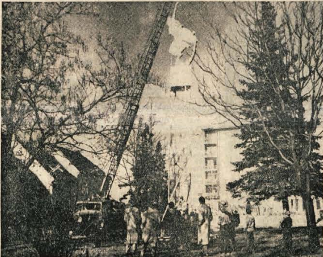
Pisali smo že o načrtih za gradnjo »Spomenika revolucije« v Kranju in pričeli tudi sako makete. Vendar je bil prvotni načrt na podlagi širokih razprav v raznih organizacijah spremenjen in so namesto dveh večjih blokov sedaj na ploščadi predvideli tri bronaste skulpture, ki bodo ponazarjale tri najpomembnejša obdobja v delavskem gibanju. V nedeljo dopolne so si Kranjčani lahko ogledali osnutke skulptur v predvideni velikosti, ki so jih postavili v Parku Svobode, da bi kipar in arhitekt tako lahko določila lego in višino, ki bi kar najbolj ustrezala okolju.

Na vseh konferencah so bili člani Socialistične zveze seznanjeni z novo vsebino dela krajevnih odborov po sklepih in smernicah 5. kongresa ter o vlogi krajevnih odborov SZDL kot družbenih samoupravnih organov. Ze sedaj se je pokazalo, da bi vso problematiko v prihodnje lahko uspešno reševali v okviru sekcij, ustanovljenih za posamezna področja dejavnosti. Potrebo po ustanavljanju odborov ali sekcij v okviru krajevnih organizacij pravzaprav narekujejo same razmere na terenu.