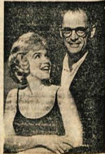
Arthur Miller in Marilyn Monroe