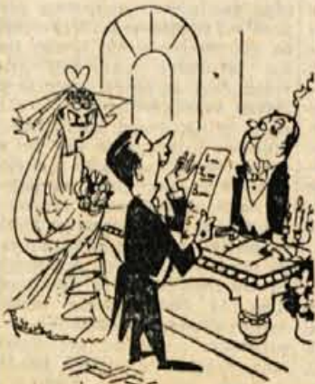
"Prisanem, samo pod naslednjimi pogoji..."