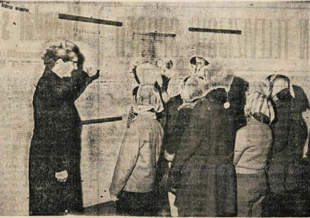
Obiskovalci Loškega gradu se vrstijo drug za drugim

Cepprav v jeseniški občini, razen dveh samopostrežnih novih trgovin, ne bodo za 29. november odprli drugih objektov, se vendar zelo marljivo pripravljajo na proslavo v počastitev letošnjega Dana republike. Solske organizacije, DPD Svoboda in druge organizacije bodo ob praznikih priredile razne akademije in druge manifestacije. — Posebne proslave so predvidene v Kranjski gorji, Račeah, v Gozd Martuljku, v Mojstrani, na Jeseniškem in Javorniškem rovtu. Osrednja občinska proslava pa bo v Titovem domu na Jesenicah. —l.e.