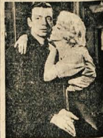
Yves in Marilyn

Ameriški književnik Arthur Miller in filmska igralka Marilyn Monroe sta se po štirih letih ločila. Zanimivo je, da so jima vsi pripisovali idealen zakon. Pravi, da je vzrok ločitve francoski pevec in igravec Yves Montand, ki ga poznamo tudi iz naše filmske koprodukcije "Velika sinja cesta" iz filmov "Precep", "Može in volkovi" itd. Marilyn je igrala z Yvesom v filmu "Ljubiva se". Na silkah vidimo - dva srečna zakonca para Marilyn Monroe in Arthur Miller ter Yves Montand in Simone Signoret ter par, ki je vzrok ločitve - Marilyn Monroe in Yves Montand.