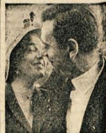
Yves Montand in Simone Signoret