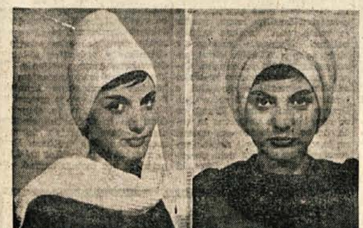
Koledarska zima se še ni začela, vseeno se nam pa že kar prileže zimski plašč in toplo pokrivalo. Na naših slikah vidimo, kako lahko z različnim spenjanjem šala naredimo priklapan, moderna pokrivala. Za šal potrebujemo 125 gramov volne in debelejšje pletilke. Šal pletite v patentnem vzorcu, širok naj bo 25 do 28 centimetrov, dolg pa 1 do 1,20 metra