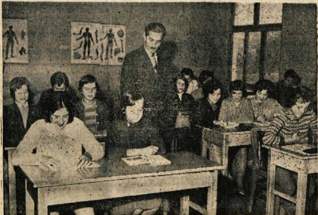
V šolskem poslopu v Goričah se je se do pred... v treh učilnicah 305 otrok. Ta problem pa so rešili z gradnjo prostorne učilnice v sedanjem gasilskem strojnem domu, ki so jo odprli konec minulega meseca. Učilnica jim služi hkrati za tehnično delavnico in telovadnico. Podobno kot v Goričah, bi tudi marsikje drugje lahko rešili problem pomanjkanja šolskih prostorov

In kdo naj po takšnem »referatu« in vodenju zbori razpravlja? Saj je bil referat že sam po sebi nekakšno obvestilo, češ da se ja ne bi zbor preveč zavlekel. Od volivcev pa se le še malokdo oglasi in največkrat z dvema besedama vse pove kar ga tišči: pri nas ni luči na cesti, brv čez potok se bo (Nadaljevanje na 2. str.)