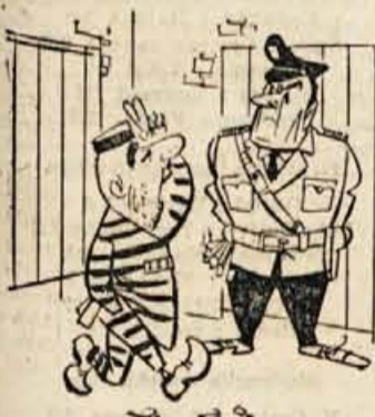
»Oprostite prosim, kje pa je izhod?«

Burja piha, piha, da drevesa naha. Mirko kiha prehlajen, vendar zmeraj sill ven.