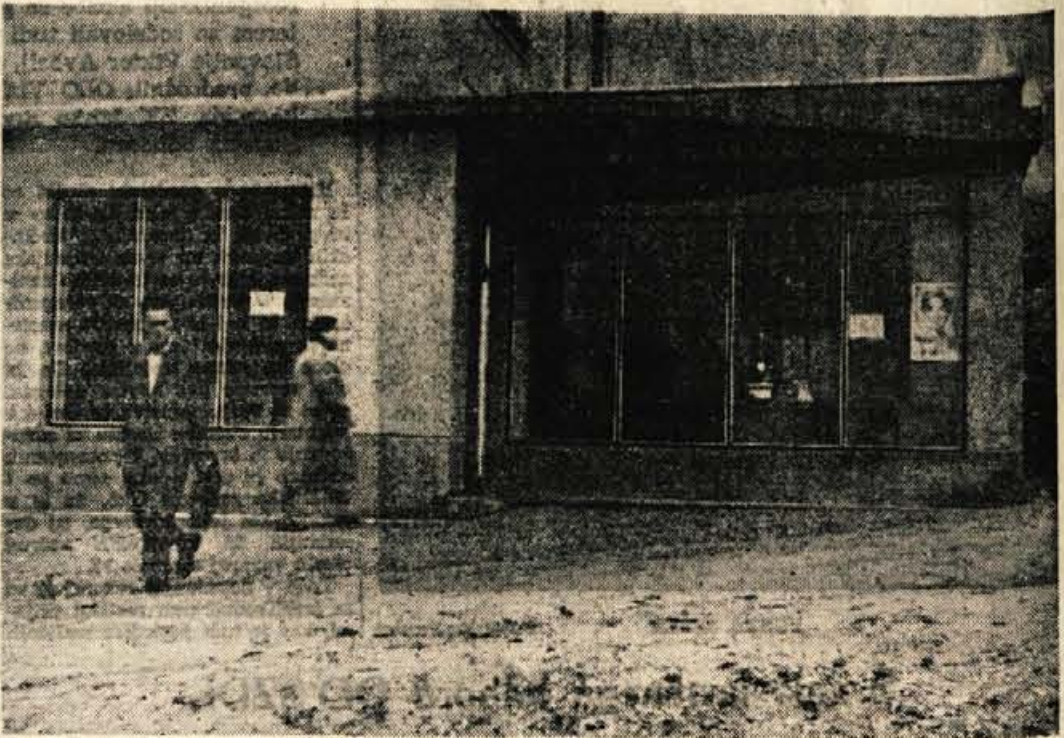
Trgovina za špecerijo in galanterijo na Golniku bo v kratkem dobila povsem drugačni videz. Omenjeni lokal so adaptirali in povečali. Sedaj prodajajo le v prizidanem delu trgovine, z rednim poslovanjem pa bodo pričeli še pred 29. noembrom, ko bodo končali z vsemi glavnimi deli.

Tudi razprava o Kongu je pokazala — čeprav ni mogla biti zaključena — da so nepovezane države sposobne najrealneje ocenjevati položaj in tudi vplivati na razvijanje mednarodnih dogovorov, da bi iz teh dogodkov izvlekle blokovske koristi.